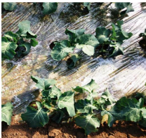
ブロッコリー 500倍希釈3回散布