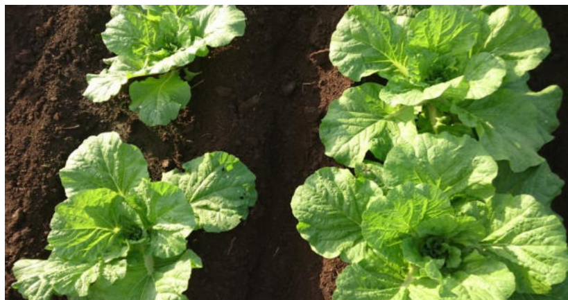
白菜 500倍希釈3回散布