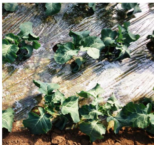
ブロッコリー 500倍希釈3回散布