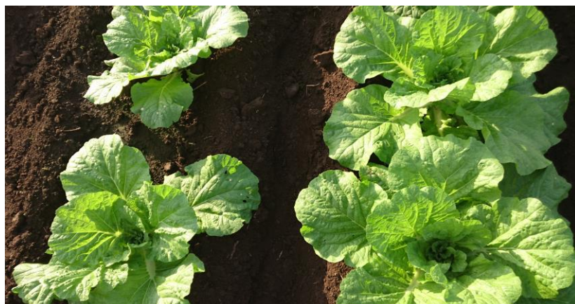
白菜 500倍希釈3回散布